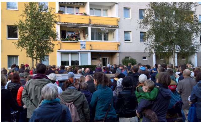
Dostojewskistraße: Singende Balkone zur Kulturnacht 2018