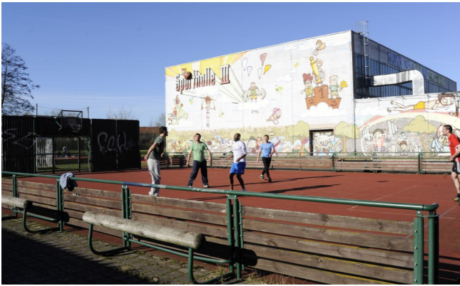
Puschkinring: Sporthalle III