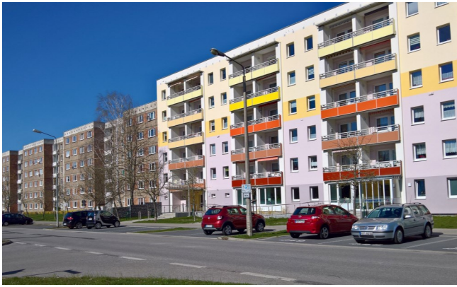
Makarenkostraße: (un-)sanierter Wohnungsbau