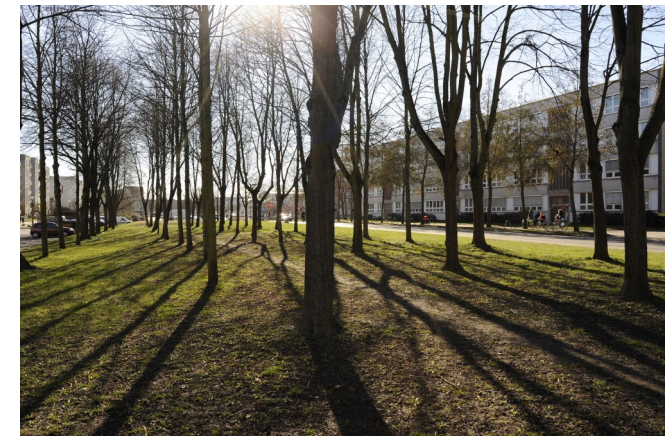
Ernst-Thälmann-Ring: Grünfläche am Humboldt-Gymnasium